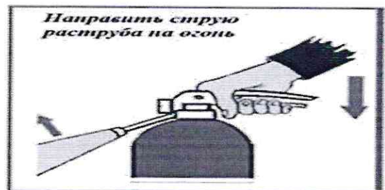
Приведение в действие ручного огнетушителя